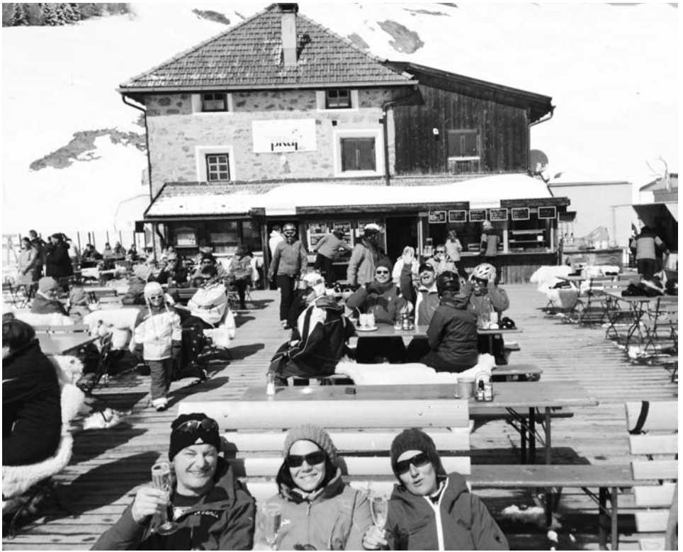
Schoenwetter im Prui