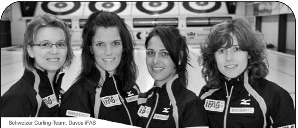
Schweizer Curling-Team, Davos iFAS

Dorfplatz, 9630 Wattwil Telefon 071 988 12 54