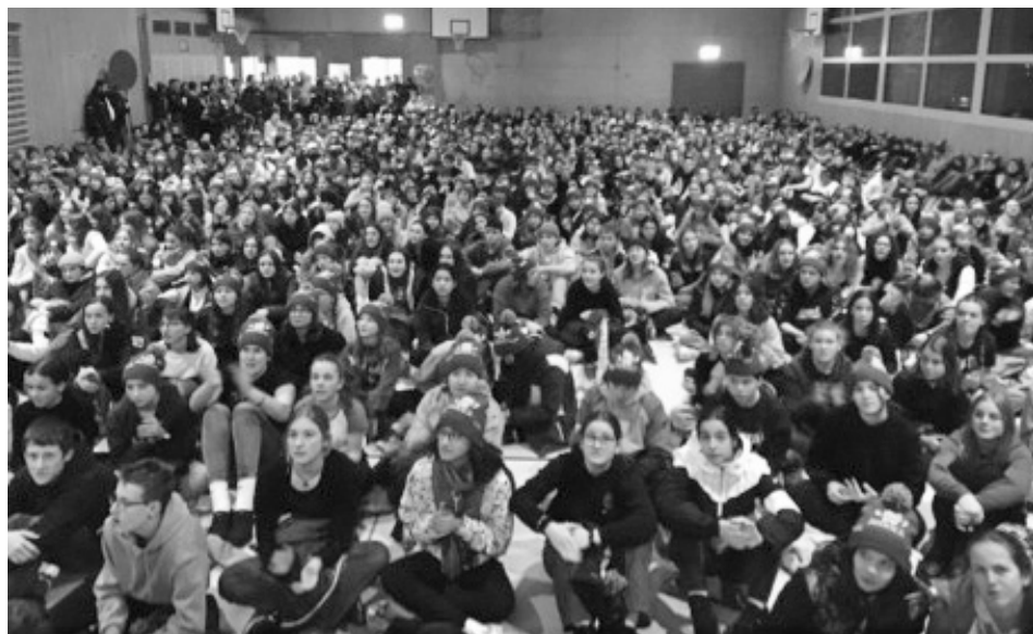
600 Kinder bei der Begrüssung in der Turnhalle