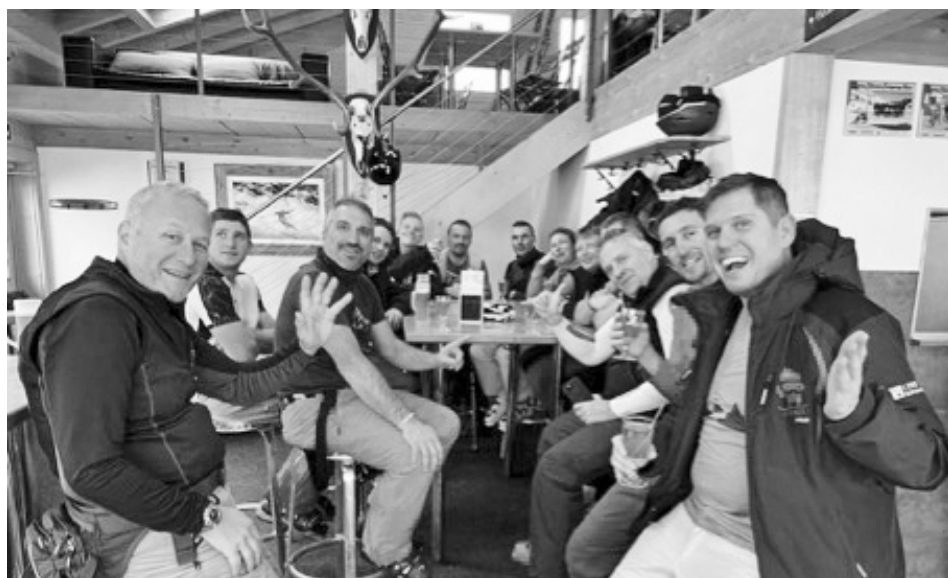
Eine von 6 Ski-Leiterteams bei der Tagesauswertung